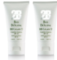
Ref. 15009 / 15092

Il risultato Il trattamento e la protezione in più! Uniformato, l'incarnato è quello di quando si torna dalle vacanze.