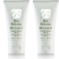
Ref. 15009 / 15092

Sonucu? Bakım ve artıdan koruma ! Tonu düzenlenmiş, cilt bir tatil dönüşü görünümünü sergiler.